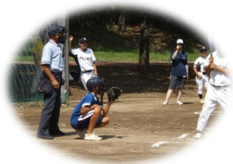
児童養護施設ソフトボール大会参加（8月）