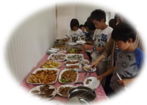
さんあいレストラン開店（6月）