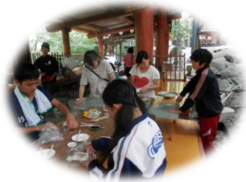
冒険キャンプの実施（7月）