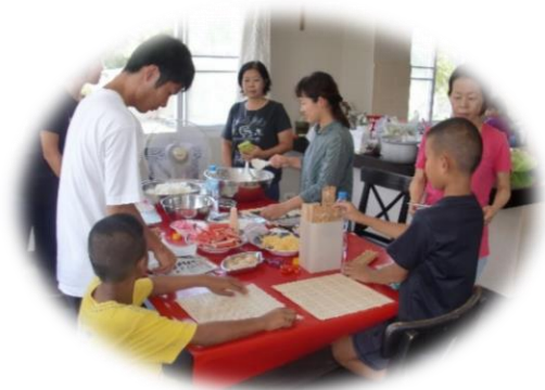
タイの児童養護施設訪問（8月）