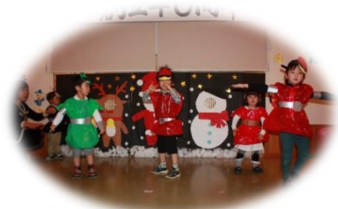
クリスマス祝会（12月）