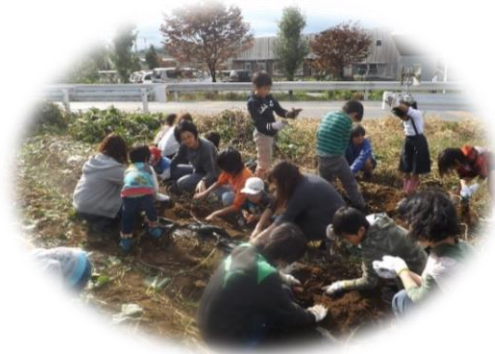
さつまいも掘り（10月）