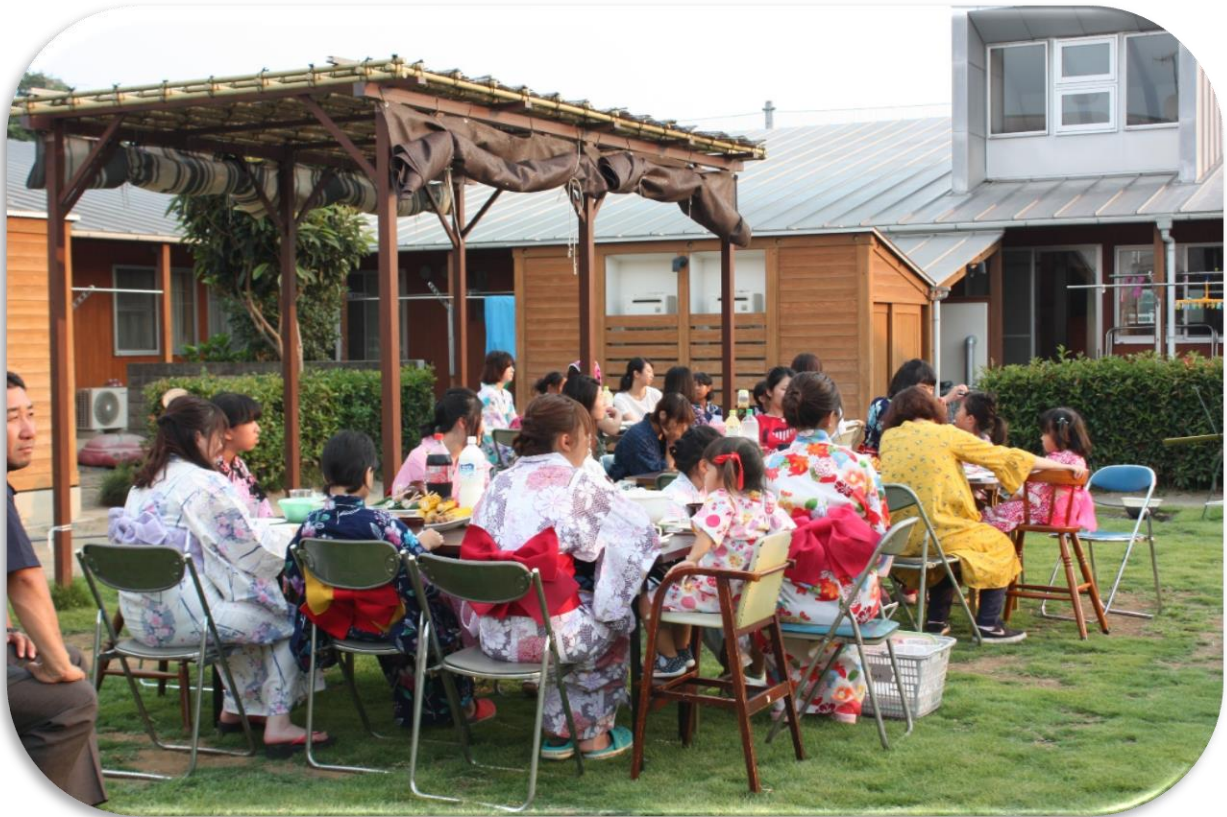
中庭でのガーデンパーティーの様子 (7月)