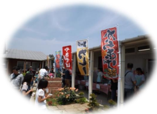
創立記念祭（さんあい祭）（5月）