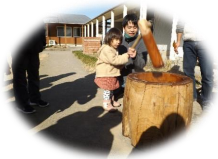
餅つき・同窓会（1月）